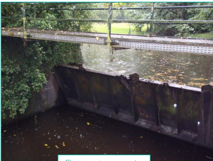
Clapet avant sa suppression